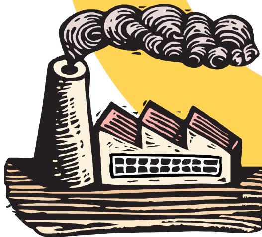
Pequeña y Mediana Empresa